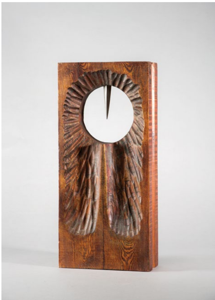
Из циклуса „Парболе”, Велики бели трн / From the cycle of “Parables”, The Great White Thorn 1998, бојена боровина и алуминијум / painted pine and aluminum, 49x22x8cm