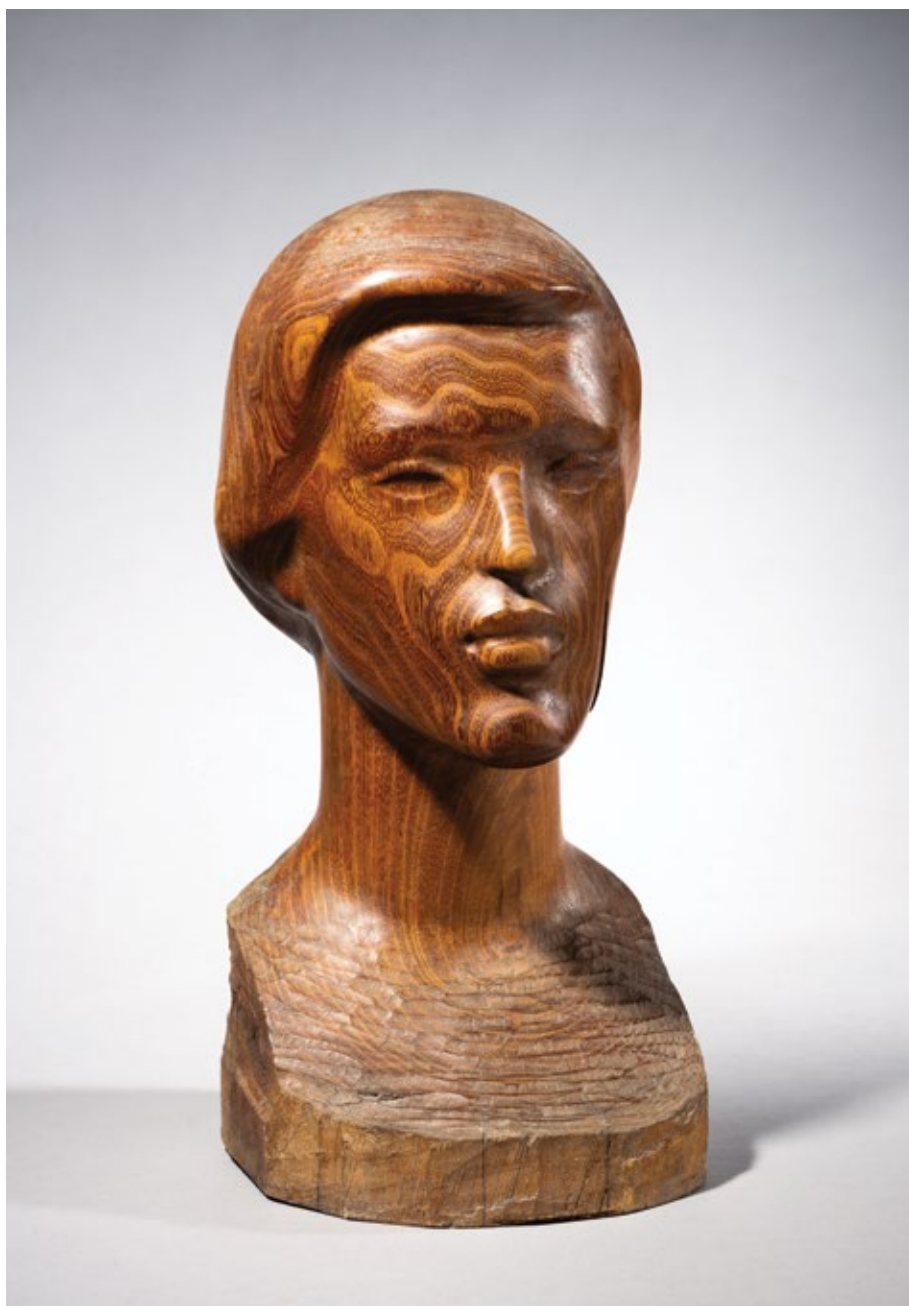
Портрет Н.С.П. / Portrait of N.S.P. 1950, дрво (багрем) / wood (acacia), 40x20x20cm