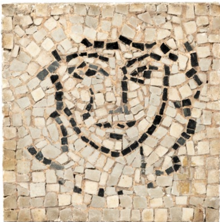
Марија / Maria 1959, мозаик / mosaic, 20x20cm