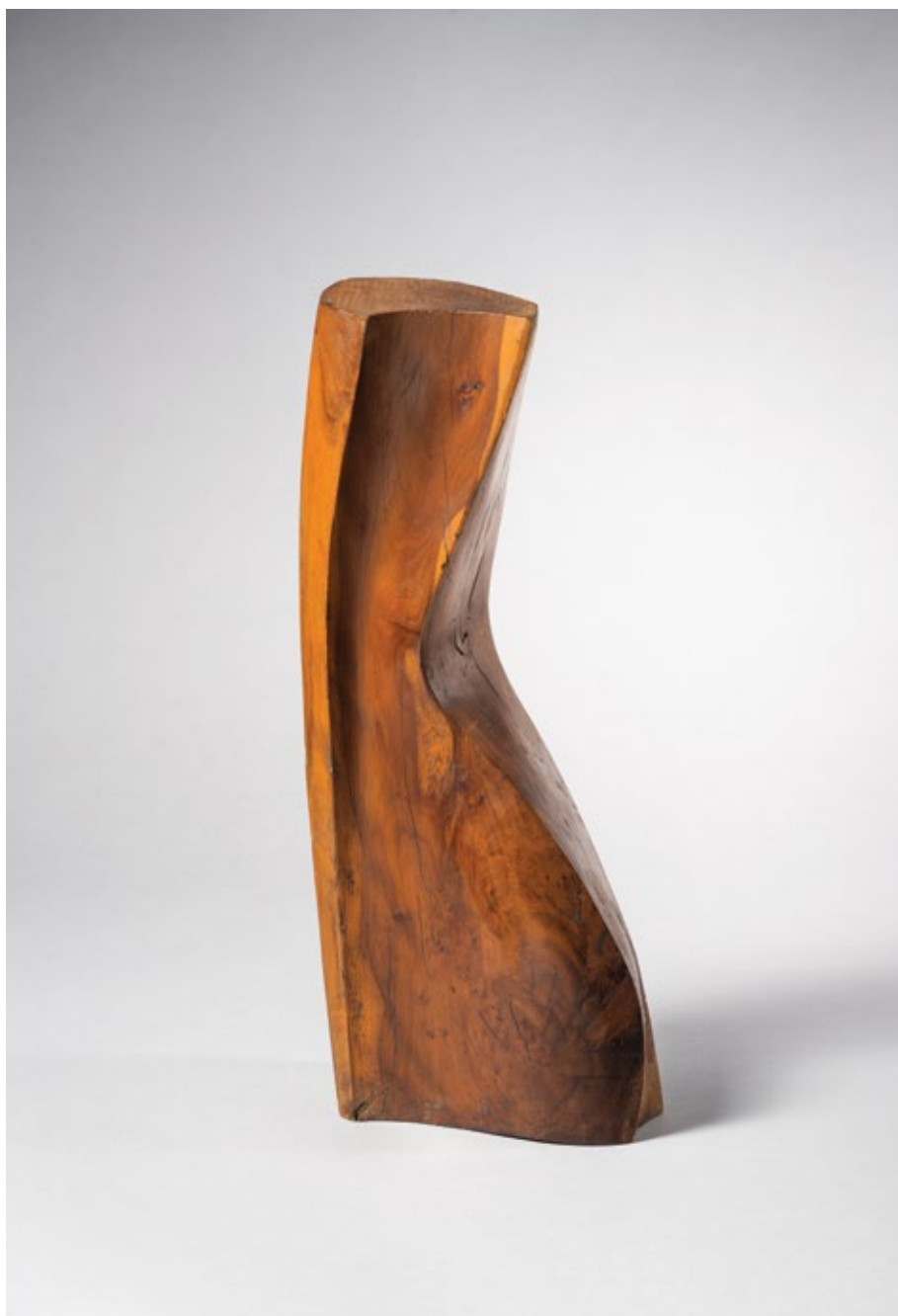
Без назива / Untitled 1967, дрво / wood, 45x15x10cm