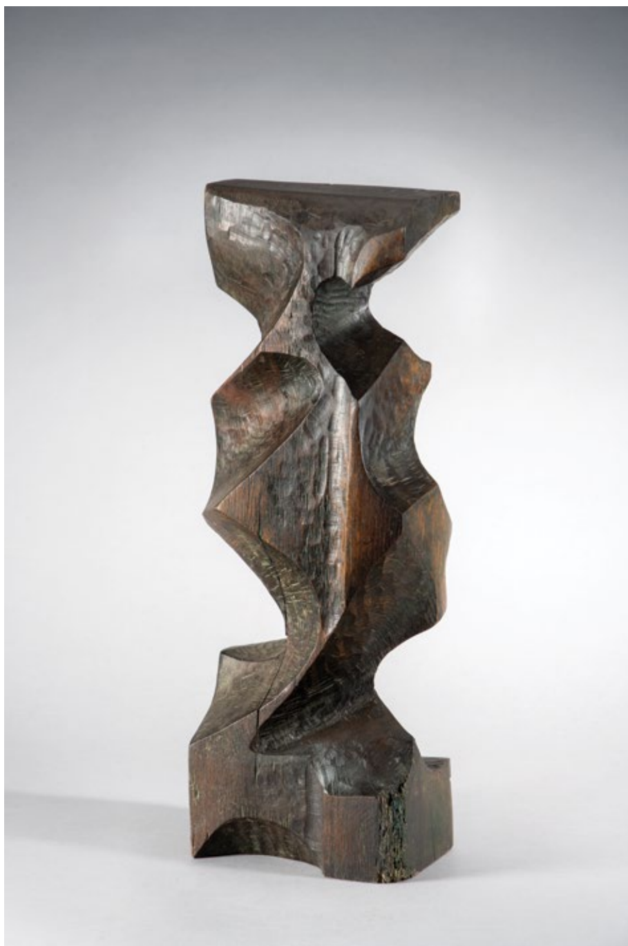
Из циклуса „Присећања” / From the cycle “Remembrances” 1979, бојено дрво / painted wood, 55x20x11cm