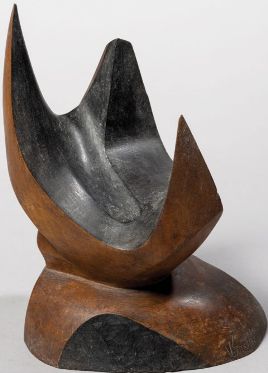
Ватра / The Fire 1955, бојено дрво / painted wood, 20x16x10cm