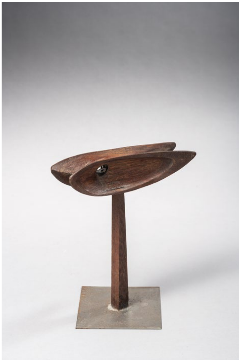
Риба која је прогутала лептира / The Fish That Swallowed a Butterfly 1993, дрво и жица / wood and wire, 28x20x6cm