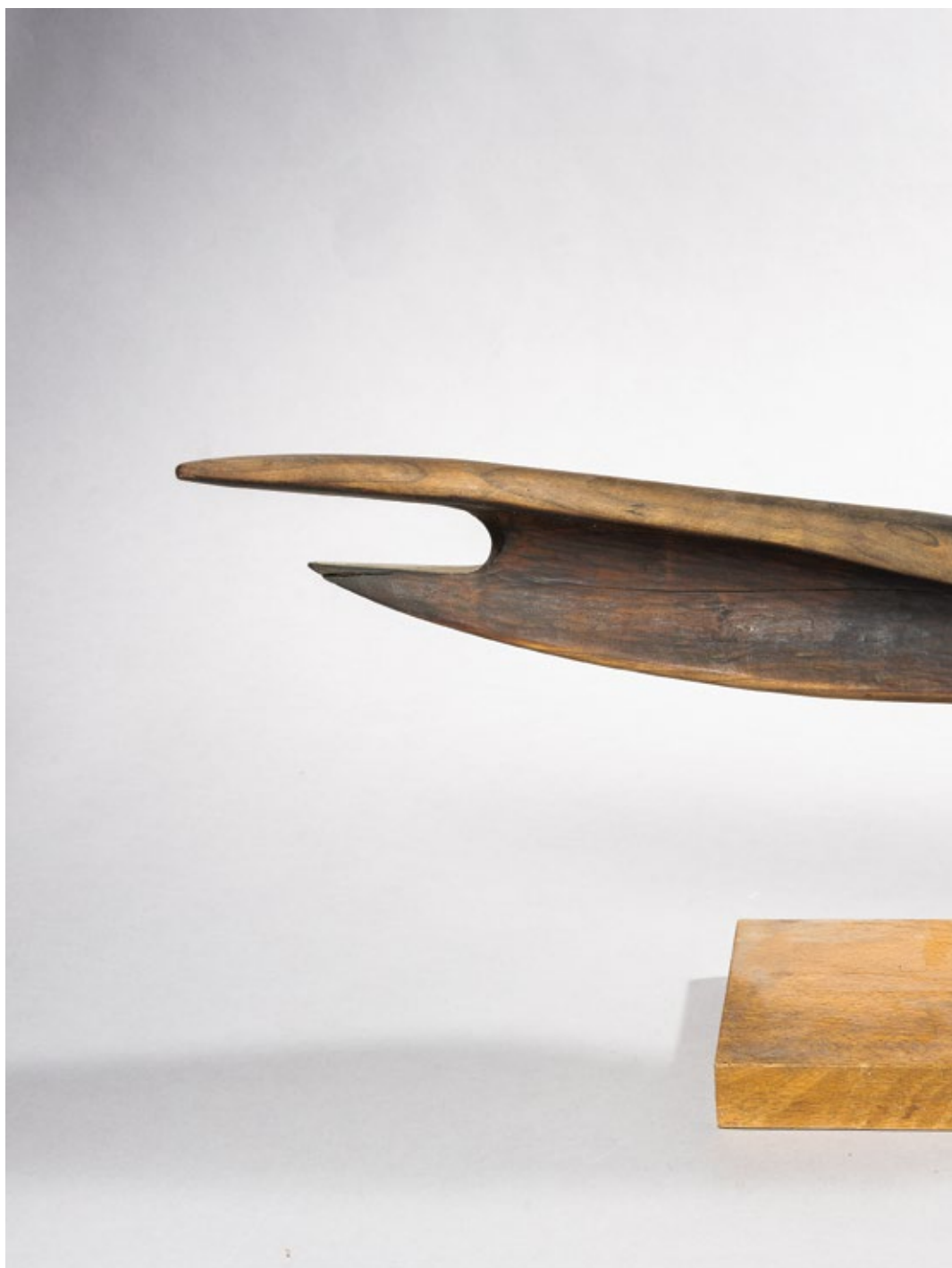
Жудња (Хрепењене) / Longing 1962, дрво / wood, 70x16x12cm