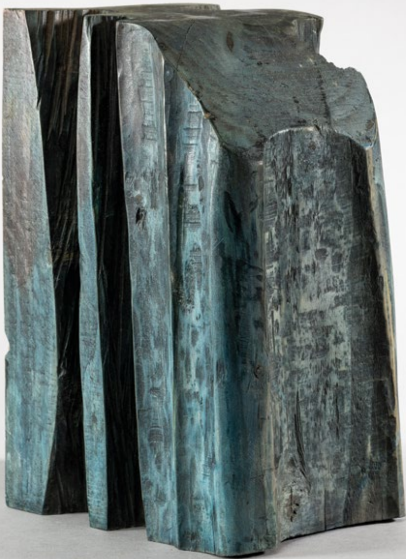
Црни белег / Black Mark

1997, бојена кедровина / painted cedar wood, 30x20x14cm