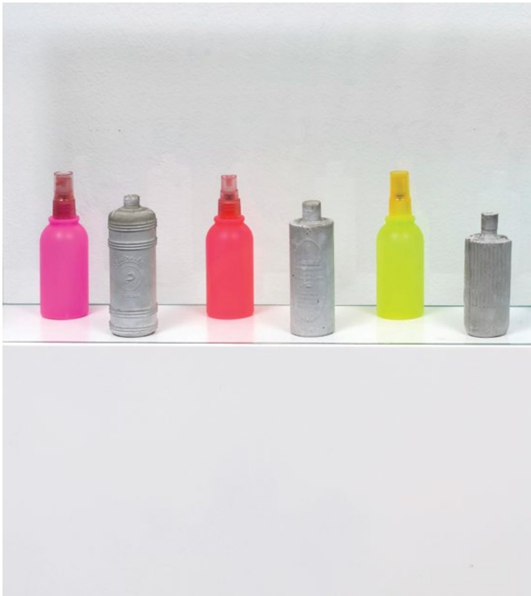
Марко Погачник / Marko Pogachnik Предмети / Objects 1968, гипс / plaster h13, h12, h11, h9cm