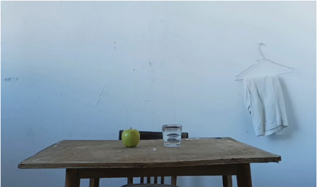
Катарина Дрењанин / Katarina Drenjanin Мртва природа / Still life 2024, видео 20 секунди / video 20 seconds