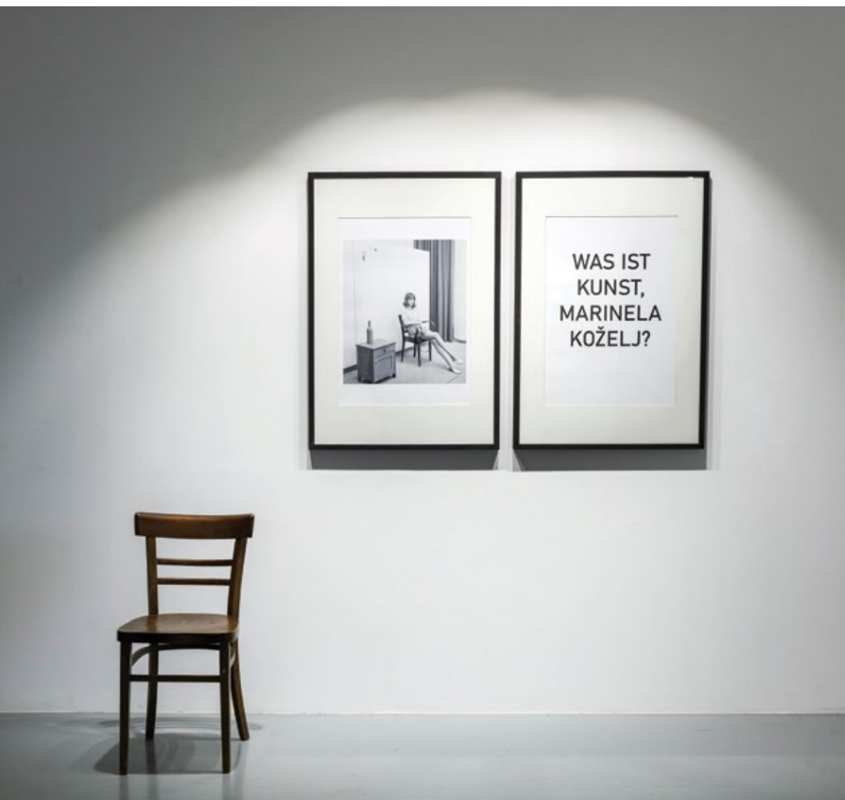
Раша Тодосијевић / Raša Todosijević