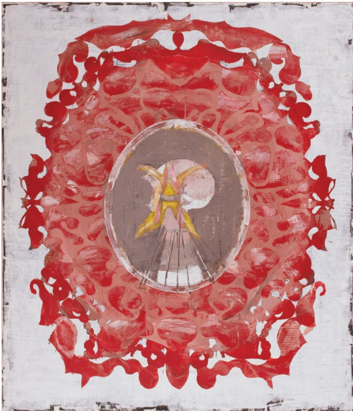
Камеја у пламену – Портрет без лица / Cameo Burst – Contortionist 2010, акрилна боја на платну / acrylic paint on canvas, 140 x 120 cm