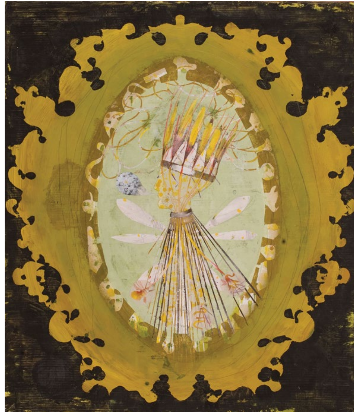
Камеја у пламену – Профил зелени / Cameo Burst – Profile in Green 2009, акрилна боја на платну / acrylic paint on canvas, 140 x 120 cm