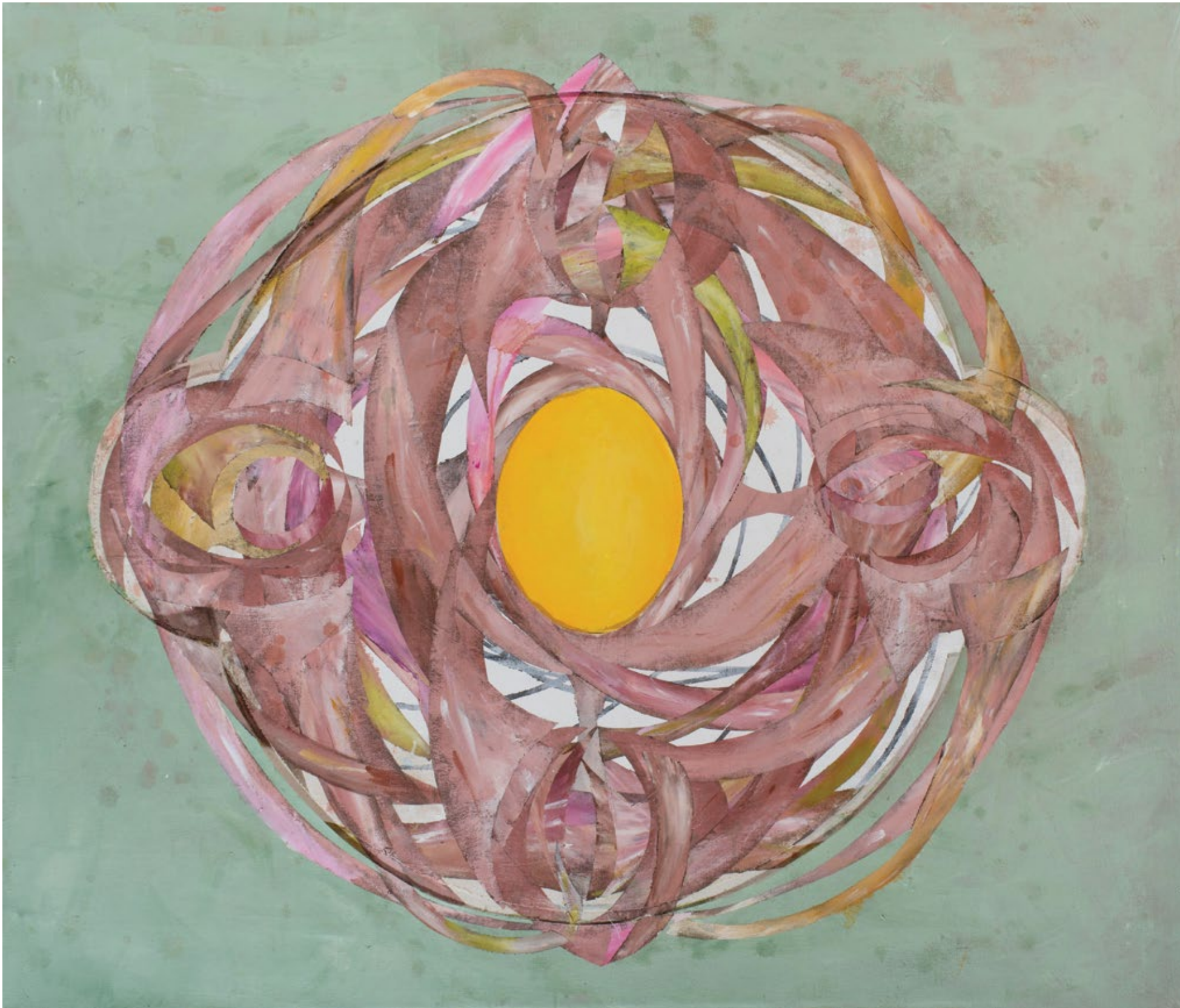
Камеја у пламену – Вихор огледала / Cameo Burst – Swirling Flesh of the Mirror 2019, акрилна боја на платну / acrylic paint on canvas, 120 x 140 cm