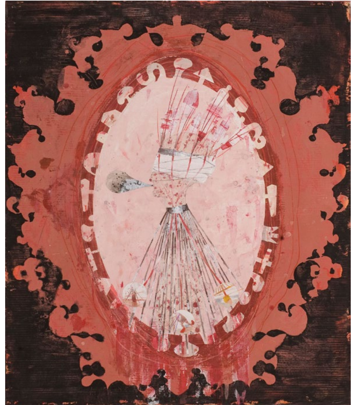
Камеја у пламену – Профил црвени / Cameo Burst – Profile in Red 2009, акрилна боја на платну / acrylic paint on canvas, 140 x 120 cm

The realism in Kralj's title is actually not as direct. Indeed, the painter is clearly abolishing the reproductive in favor of the productive. By, at first, focusing on a precise, subtle drawing in a focal point of the canvas and then leading that focus towards a completely abstract, often monochromatic field surrounded by vibrant flickers of color, which may also be a destroyed canvas – cut up, torn off and then glued into a "relief". So, the cameo is also a symbol, but Kralj is not evoking an object; rather, he is "throwing" it into the flame and claiming, what is an indispensable truth – that art is a need and that we can make out a ray of hope of such a possibility in the flame of his paintings.