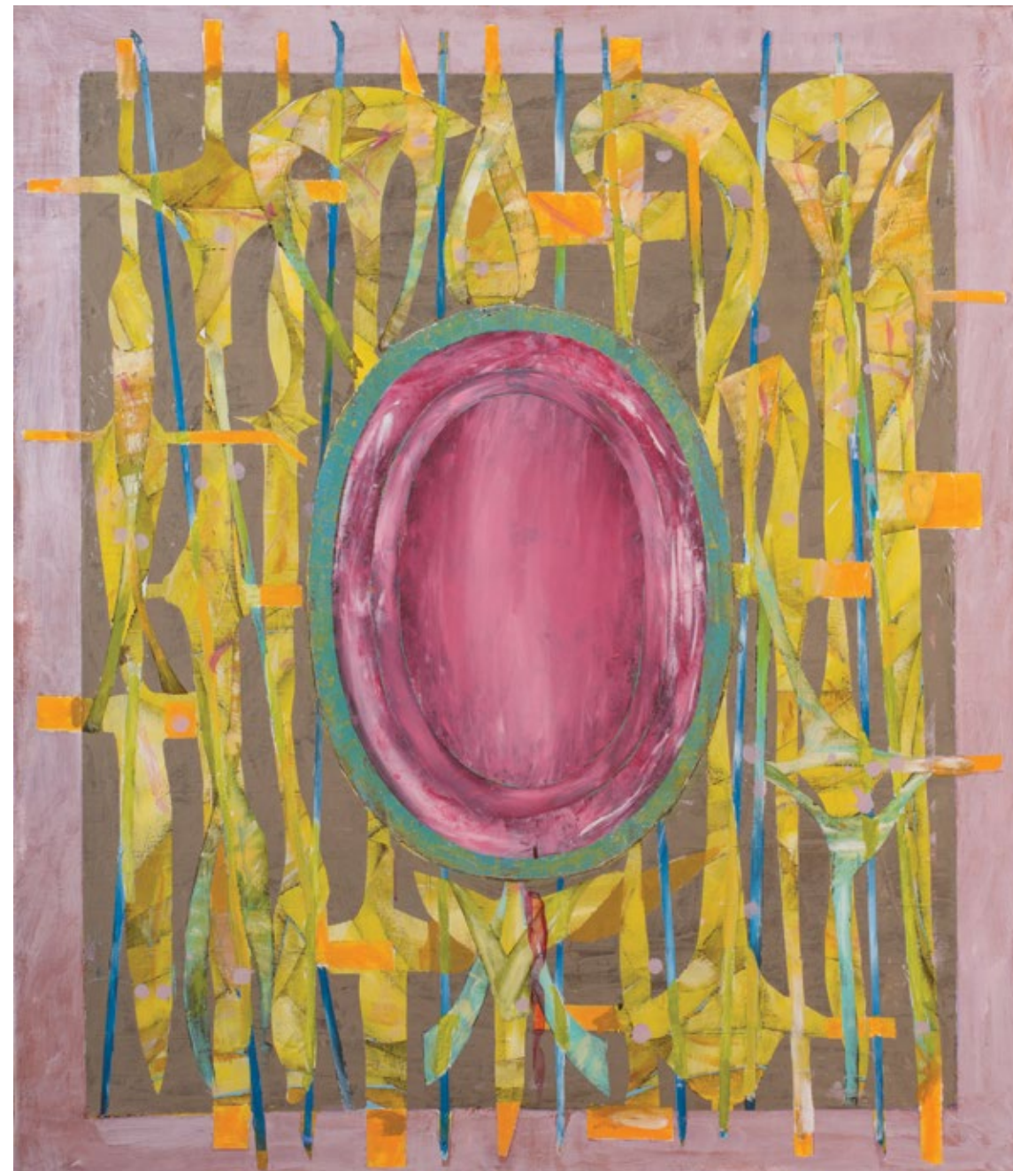
Камеја – Сто налаза / Cameo – Table of Contents 2019, акрилна боја на платну / acrylic paint on canvas, 140 x 120 cm