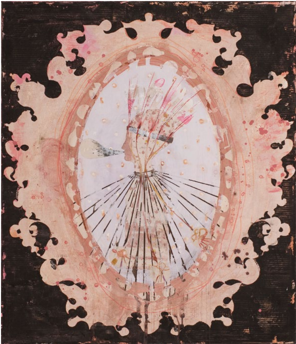
Камеја у пламену – Профил у виолет / Cameo Burst – Profile in Flesh 2009, акрилна боја на платну / acrylic paint on canvas, 140 x 120 cm