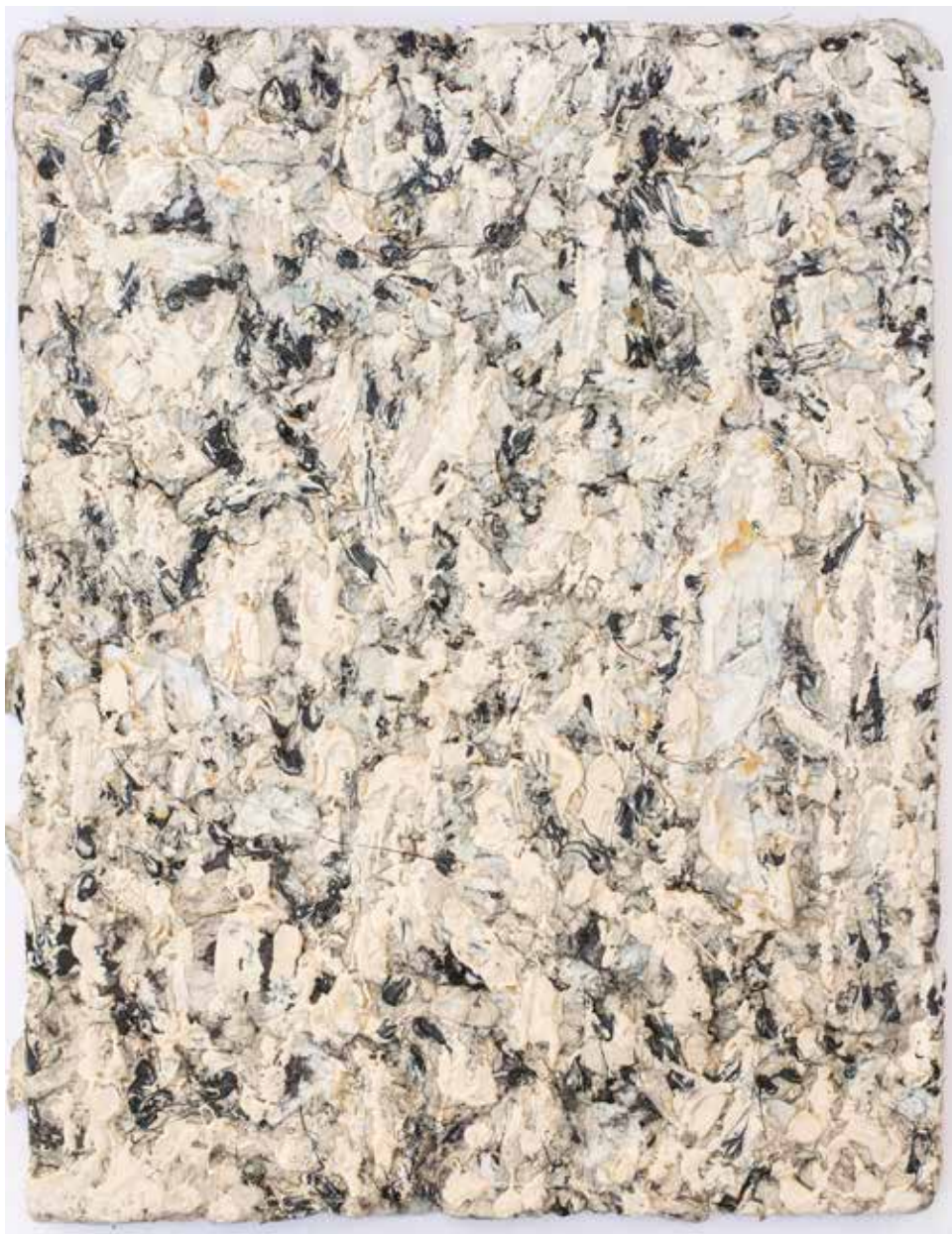
Папирне масе, 39 x 30 / Paper masses, 39 x 30