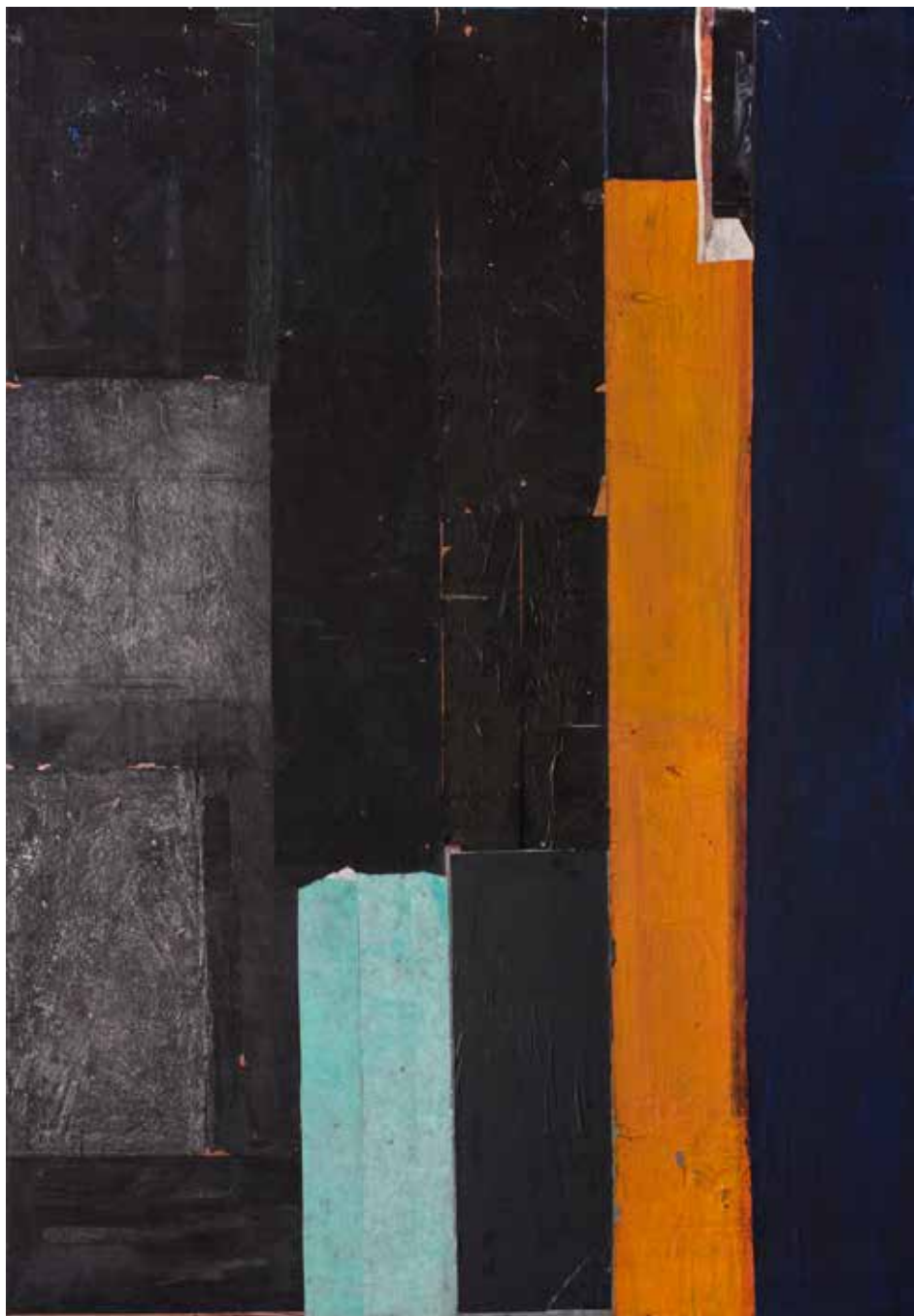
Барселона, 1996, 216 x 150, пигменти на јапанском папиру Barcelona, 1996, 216 x 150, pigments on Japanese paper