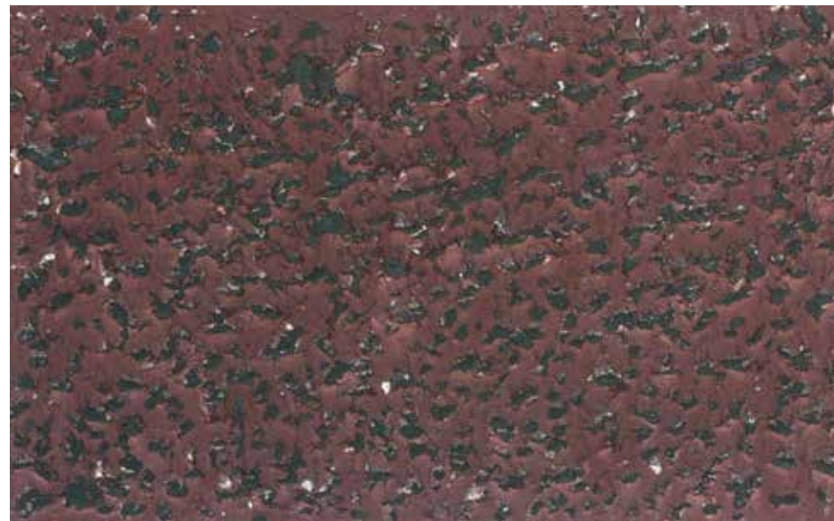
Радови на папиру, 123 x 83 / Works on paper, 123 x 83