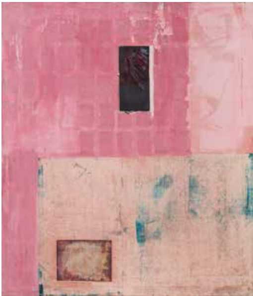
Без назива, 130 x 112, пигменти на јапанском папиру Untitled, 130 x 112, pigments on Japanese paper