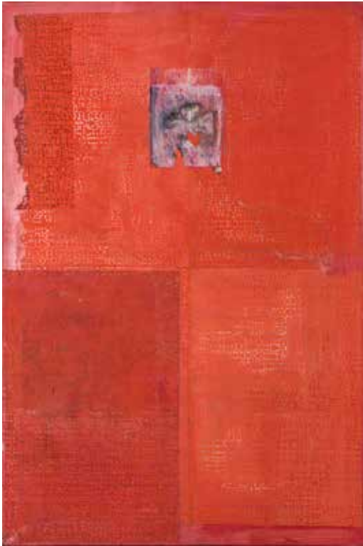
За Емилију Прицу, 1997, 194 x 130, пигменти на јапанском папиру For Emilija Prica, 194 x 130, pigments on Japanese paper