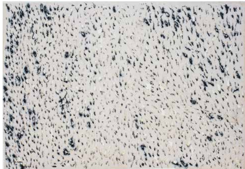
Радови на папиру, 123 x 83 / Works on paper, 123 x 83

...То мајсторско, екстремно самопоуздано, авантуристичко путовање пулпом папира окончава се, боље рећи продужава се “до у бескрај”, у бојеним цепаним, гужваним папирним отпацама, за излагање лепљенима као окаченима о подлогу: они принуђују да им се у великом простору белине папира под собом призна статус “готовог” објекта, скромног до понизности и у исти мах мистериозног, објекта који репрезентује парадоксалан али неодрљив, јединствен пробој Радетовог постминималистичког ethosa у енформел.