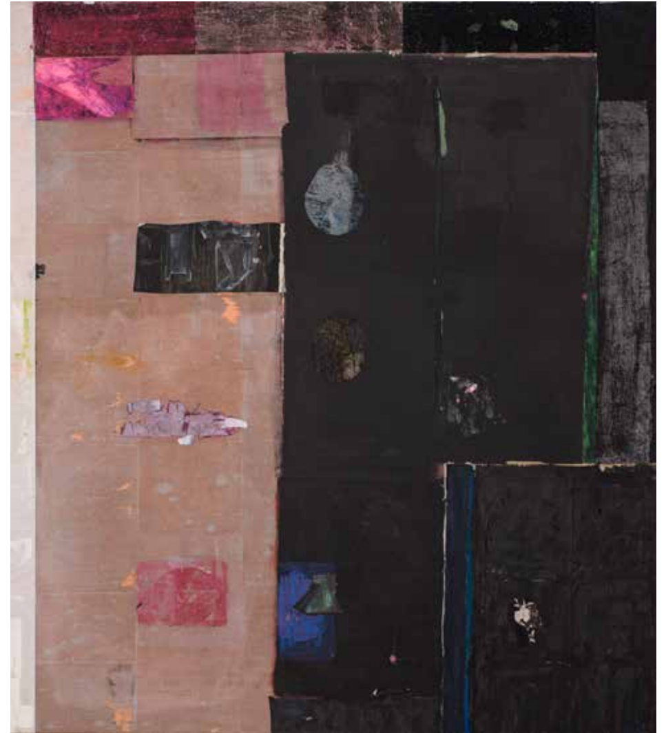
Без назива, 200 x 190, пигменти на јапанском папиру Untitled, 200 x 190, pigments on Japanese paper