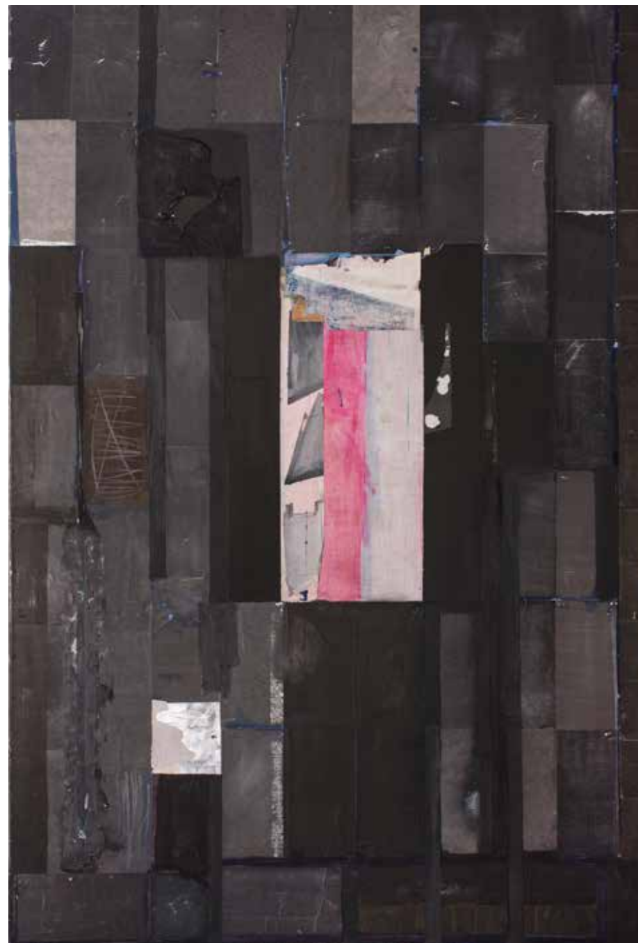
Без назива, 194 x 130, пигменти на Јапанском папиру Untitled, 194 x 130, pigments on Japanese paper